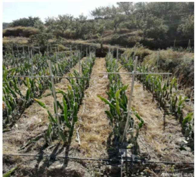
图2 “垂向栽培”种植法。

“垂向栽培”种植法栽培(见图2)具有采光效果好、使用期限久、搭架便捷、人工成本低、节约土地空间、枝条修剪方便等优点。根据大凉山地区年均温在16-25℃, 光照很有优势, 不用施加薄膜也依旧光照充足, 为此, 我们认为垂向栽培技术更适合在大凉山地区发展, 种植方法