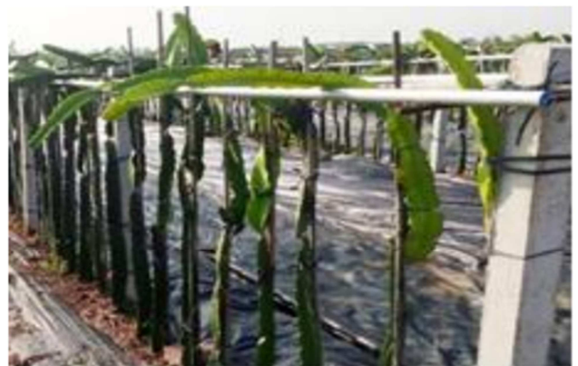
图1 水泥柱式种植法。

火龙果的传统种植搭架有“水泥柱式”种植法(如图1)、“钢丝篱笆式”种植法等方法。其中, “水泥柱式”栽培容易导致火龙果的气生根缠绕在水泥柱上, 使气生根在水泥柱上无法吸收养分, 增加了细菌感染风险; “钢丝篱笆式”种植法需要人工的成本较高, 而且随着种植年限的增加, 枝条过重, 钢丝老化, 最终导致钢丝无法承受枝条重量而整排坍塌, 并引起主干的折损和断裂。以上两种种植方法都存在着一定的弊端, 容易导致株间枝条相互交杂, 混乱不堪, 从而影响太阳光照和日常管理, 并且后期难以修剪[1]。