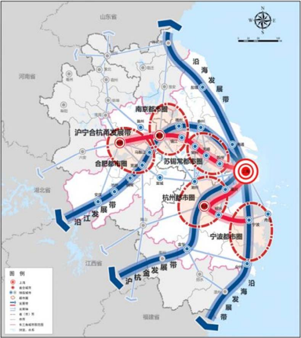
图3 长三角城市群空间格局示意图。