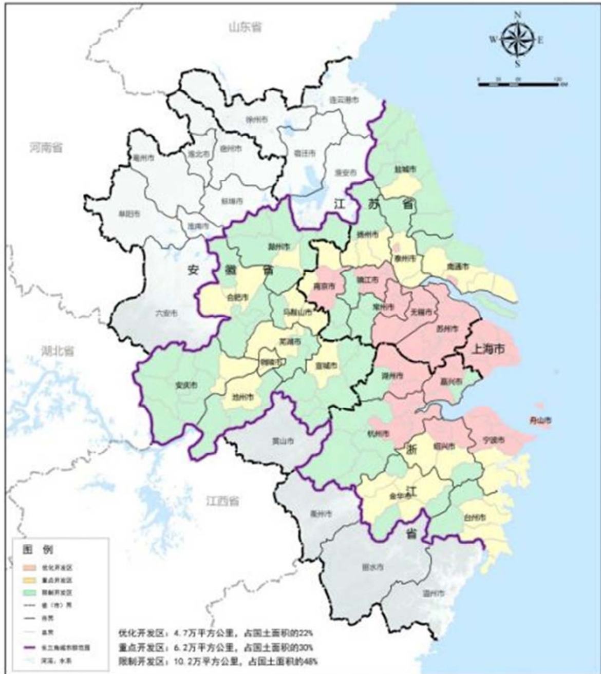
图2 长三角城市群主题功能区示意图。

值得注意的是在2017年以前，是唯一三个脱离于五大都市圈中发展的二类大型城市中（其余两个城市为盐城市与泰州市）（表2）。直至2016年，《上海市城市总体规划（2017-2035年）》中提出了将中国苏州、无锡、南通等地区纳入上海大都市圈范围内，形成90分钟交通出行圈，至此南通市才改变了原有孤立发展的城市格局，紧密联系上海，与上海大都市圈系协同发展。