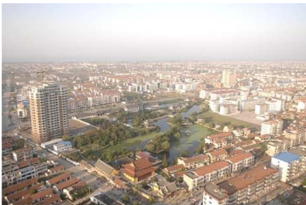
图8 启东市城市空间结构图。