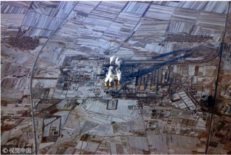
图6 东北老工业基地。